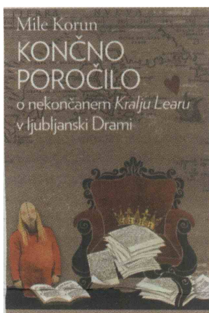
Poročilo o predstavi, ki je morala ostati nekončana.