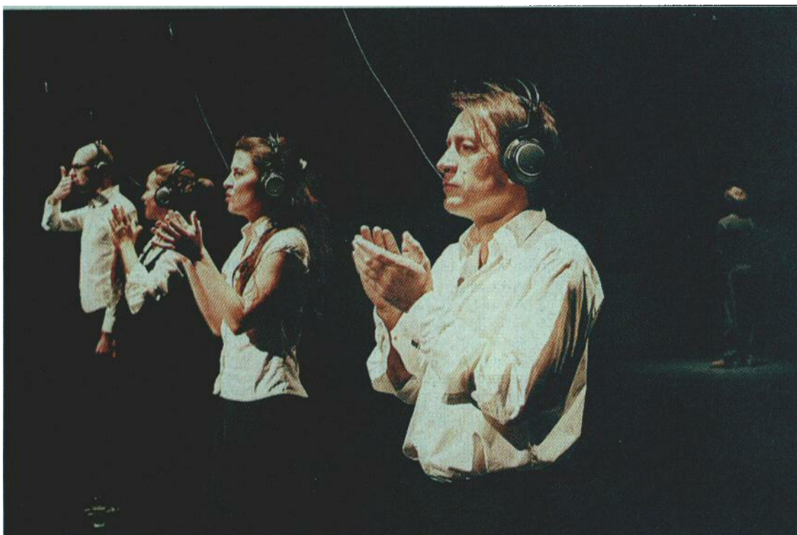
Slovensko narodno gledališče (Janez Janša), Maska, 2007

vanju mediatiziranega gradiva v sicer začasno dominantno živega znotraj performativnega dogodka, obnovitvenim postopkom ritualnega, lahko bi rekli obrednega gledališča.