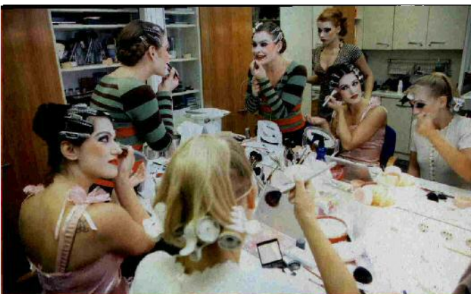
V zakulisju potekajo še zadnje priprave. Umetne trepalnice, bela lica in pričeske, kot se spodobi za plesalke kluba Kit Kat.