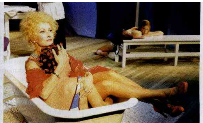
Nova sezona v Mestnem gledališču ljubljanskem je zaživela z Molièrovo predstavo.