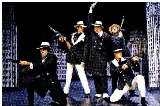
Zapletov ne zmanjka – gangsterji fanta lovijo naprej.