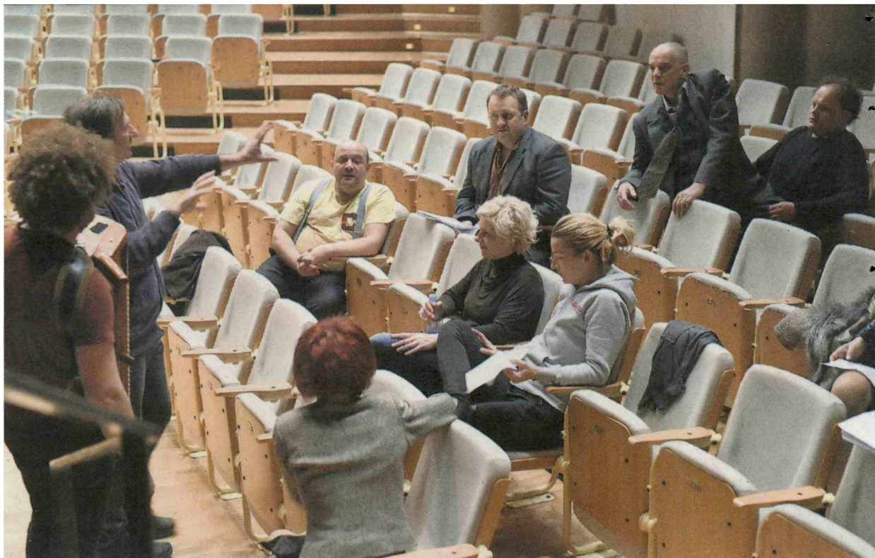
Za pripravo predstave je bil na voljo le dober mesec in pol, besedilo je bilo v tem času tudi večkrat predelano, zato so morali ustvarjalci napeti vse svoje moči.