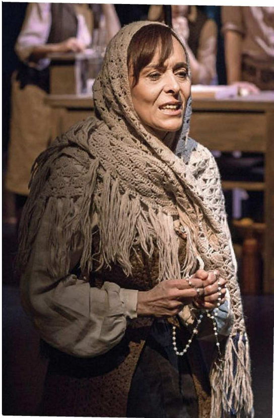
V vlogi dekle v Samorastnikih