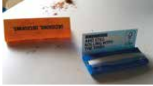
Rolling with the times

Kuharice včasih hrepenijo, nostalgirajo in patijo, toda z zavedanjem, da se svet vrti naprej, one v njem in z njim: